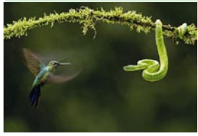
Colibri et vipère arboricole Costa Rica