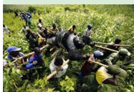
Gorille tué par balle