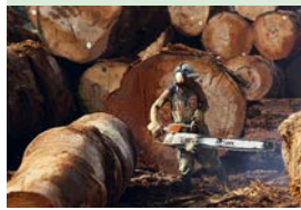
Exploitation forestière Cameroun