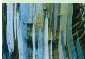
Ecorce d'un eucalyptus,