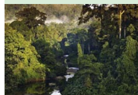
Forêt humide Malaisie