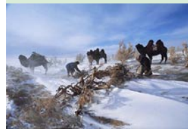
Collecte du bois, désert de Gobi Mongolie