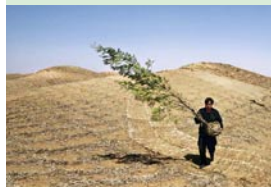
Afforestation sur des dunes Chine