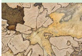
Coupe d'un tronc de hêtre