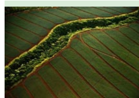
Forêt tropicale humide Etats-Unis d'Amérique