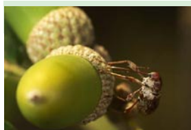
Un balanin des châtaignes