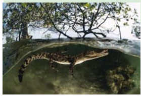
Jeune crocodile de mer Indonésie