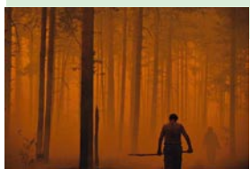
Incendie de forêt Russie