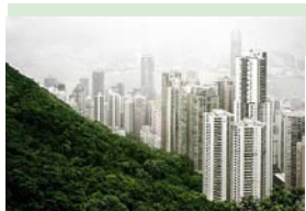
Forêt dominant Hong-Kong Rép. pop. de Chine