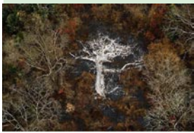
Cendres d'un arbre Côte d'Ivoire