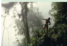
Chasseur Taw Batu