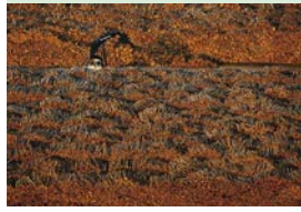
Stock de bois Suède