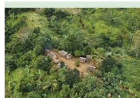
Village en forêt Madagascar