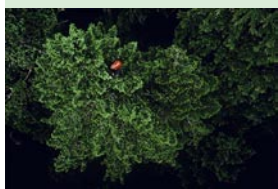
Un scientifique étudie les lichens