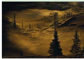
Réserve naturelle de Thelon Canada